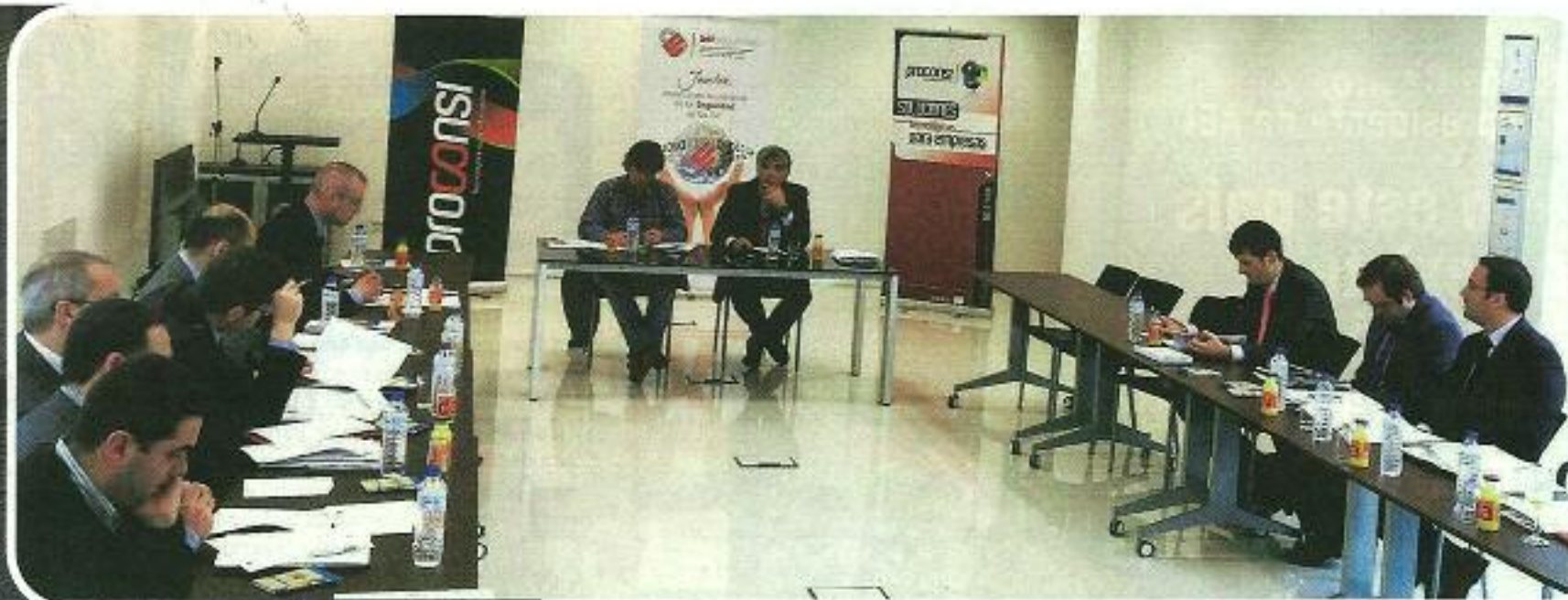
Las instalaciones del Inteco acogen la sede de la Agrupación. Sobre estas líneas, una reunión de su junta directiva.

didáctica. En estos momentos, desde la Agrupación participa activamente en dos programas de estudios superiores: un Máster Profesional en Tecnologías de Seguridad, en colaboración con Inteco y la Universidad de León (ya en su quinta edición); y un Máster en Desarrollo de Aplicaciones de Movilidad Seguras, organizado por la Universidad de Valladolid, y en colaboración con la AEI de Movilidad y ADE.