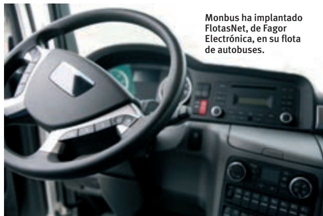
Monbus ha implantado FlotasNet, de Fagor Electrónica, en su flota de autobuses.

mente es la herramienta necesaria para medir, y por inercia, es lo que lleva a una mejora continua necesaria para cualquier empresa”.