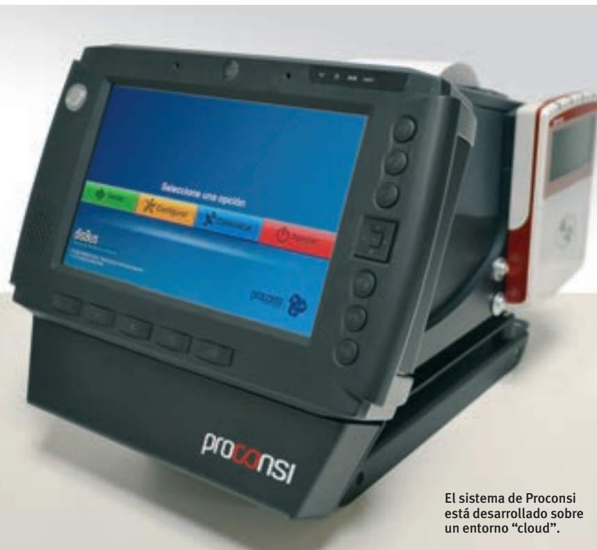
El sistema de Proconsi está desarrollado sobre un entorno "cloud".