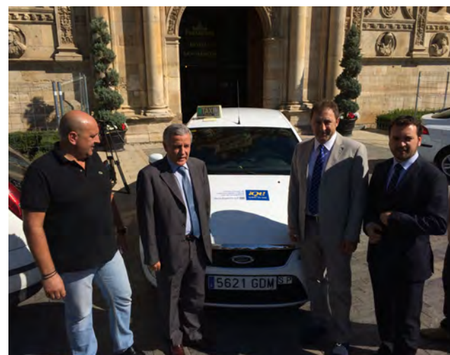
El alcalde posó con uno de los taxis.