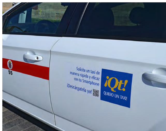
Inscripción de la app en los taxis.