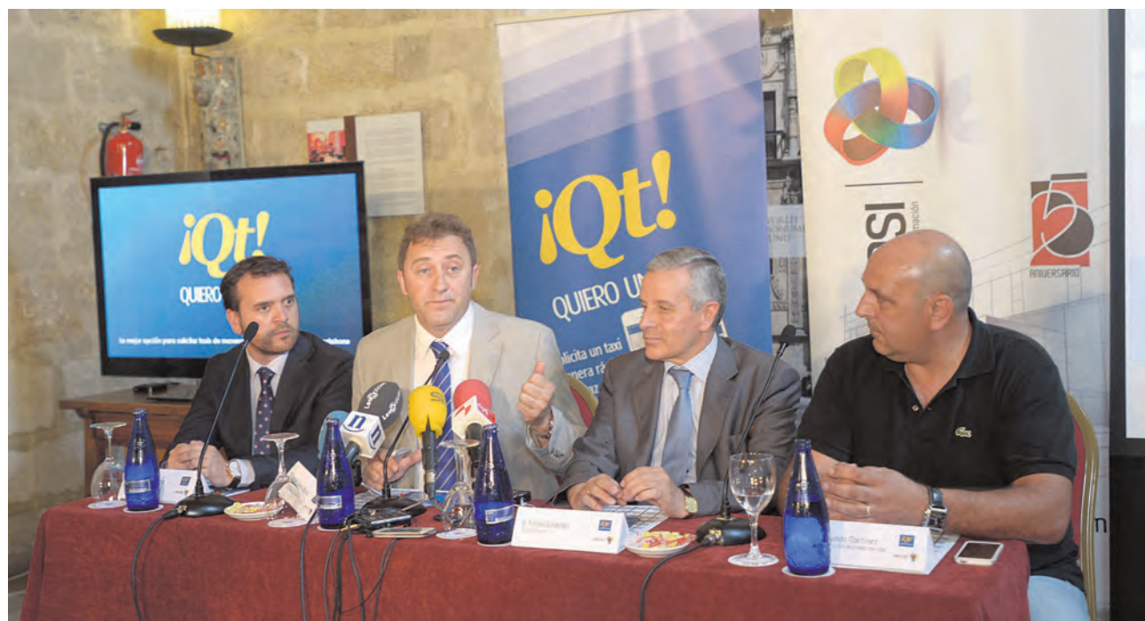
La presentación de la app ¡Quiero un taxi! tuvo lugar ayer en el Parador de San Marcos.